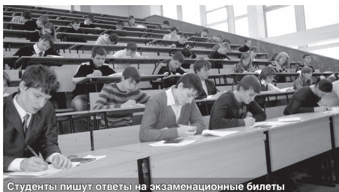
Студенты пишут ответы на экзаменационные билеты

6) И главное — вы это уже проходили и не раз. Есть опыт и уверенность в том, что при правильной подготовке сессия пройдёт спокойно и именно так, как вам необходимо.