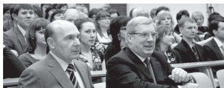
Ректор НГУЭУ Ю.В. Гусев и полномочный представитель президента РФ в СФО В.А.Толоконский

Празднование 45-летия Новосибирского государственного университета экономики и управления состоялось 28 декабря 2012 года. Официальные мероприятия посетили полномочный представитель Президента РФ в Сибирском федеральном округе Виктор Толоконский и глава департамента культуры, спорта и молодежной политики мэрии г. Новосибирска Николай Черепанов.