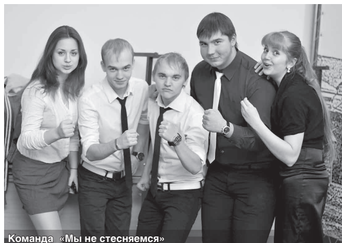
Команда «Мы не стесняемся»