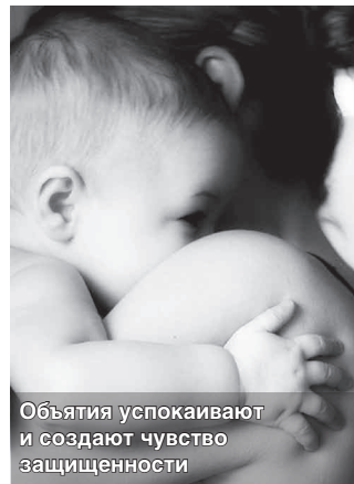
Объятия успокаивают и создают чувство защищенности

С детства мы помним, как в горькие минуты плакали и бежали к своим родителям или бабушкам, прижимались к ним и успокаивались в их объятиях. И в этот момент нам становилось хорошо, появлялось чувство безопасности, а расстроившее нас событие казалось не таким уж и страшным. Но ведь и взрослому человеку, когда ему пло-