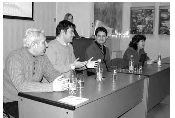
Гости из Турции выступают перед студентами НГУЭУ – будущими специалистами сферы туризма

Во всяком случае, турецкие гости, побывавшие на кафедре и встретившиеся со студентами, такую идею предложили и заключили предварительное соглашение. Их компания работает преимущественно на туристских объектах турецкого побережья Эгейского моря, но также и во многих других местах. Стажеры будут готовиться для работы в турфирмах и отелях эгейского побережья и других традиционных туристских регионов мира, а учебный центр со временем может разрастись в региональное представительство Teztour.