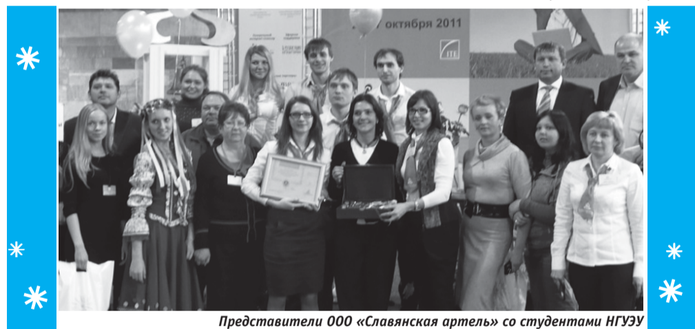
Представители ООО «Славянская артель» со студентами НГУЭУ