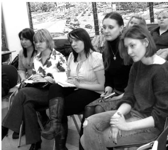
PR-клуб: работа началась

Участники PR-клуба заранее получили домашнее задание, выполняя которое, предложили свои решения для продвижения игр «Alawa» на новых рынках. Таким образом, были созданы условия, приближенные к реальности: презентация проектов руководству и получение обратной связи. Организаторы подчеркивают: в проекте не играют в PR, а выполняют реальные задания, способные