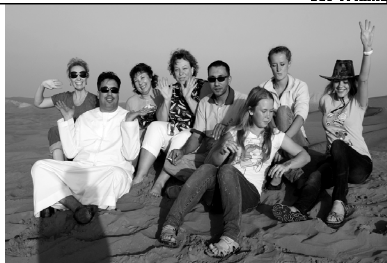
И все-таки, несмотря на все современные чудеса, главной достопримечательностью здесь является песок

Самым известным историческим местом является Дубайский музей, интересный своими подземными экспозициями, посвященными традиционным занятиям арабов. После посещения этого музея мы вышли к бухте, чтобы сделать фотографии, и решили прокатиться в лодке, которая переправила нас на другую сторону бухты. С лодки открывался красивый вид на берег, где все сверкало, светилось, пальмы стояли наряженными в огоньки, как новогодние елочки, небоскребы величественно возвышались над старыми зданиями... Было такое ощущение, словно ты попал на страницы «Тысячи и одной ночи».