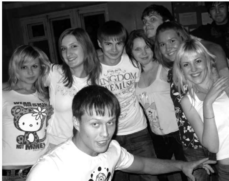
Группа участников посвящения

этими жизненно необходимыми качествами, студсовет ИМОИПа решил отправить всех новичков на «медосмотр».