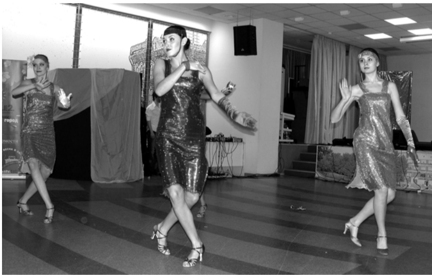
Выступает ансамбль «Шпильхаус»

Все вышеперечисленное – далеко не полный список интересных дел студклуба. Поэтому если у кого-то есть собственные задумки и идеи по созданию новых студий, проектов, – не стесняйтесь обращаться с этими идеями в СК. Возможно, вам удастся увидеть их реализованными. Ведь студенческая жизнь на учебе не замыкается, в нее можно и нужно добавить много ярких и знаменательных событий, интересных знакомств, которые можно обрести в студенческом клубе, расположенном на Каменской, 52 (третий корпус, первая вставка).