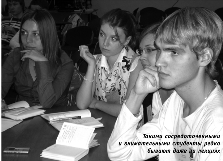
Такими сосредоточенными и внимательными студенты редко бывают даже на лекциях

например, с современной антропологией, с методологией проведения форсайт-семинаров. Тем не менее, региональный уровень представлен. Думаю, у нас сегодня получился не совсем даже семинар, а экспериментальная дискуссионная площадка.