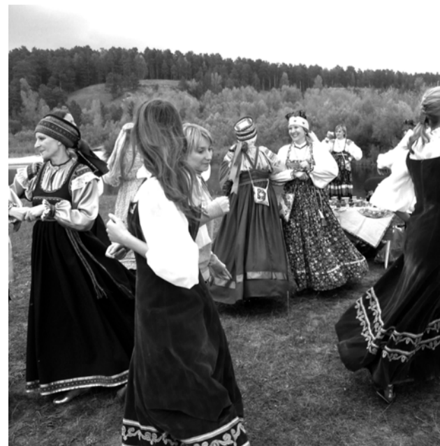
Без русской пляски и праздник – не праздник