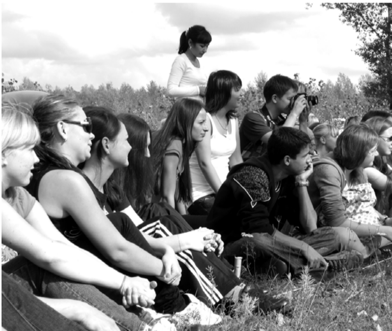
Битва вызвала живейший интерес зрителей