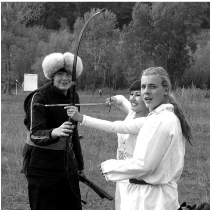
Ну где еще можно испытать себя в стрельбе из лука?